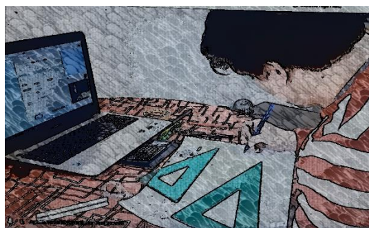
Figura 2: Plano de trabajo